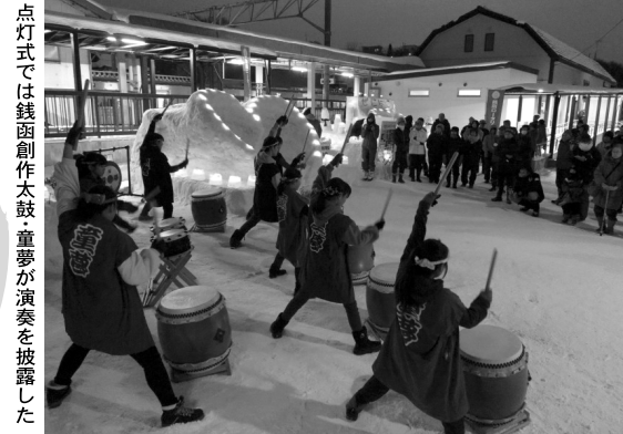
点灯式では銭函創作太鼓・重夢が演奏を披露した