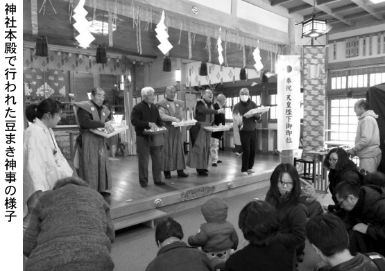
神社本殿で行われた豆まき神事の様子

壇上から小袋に詰められた豆をまき、集まった30人ほどが豆を捕って、節分を祝った。豆まきでは、小袋の中に豆とともに黄色い札が入っていたら、景品が当たるというお楽しみもあった。