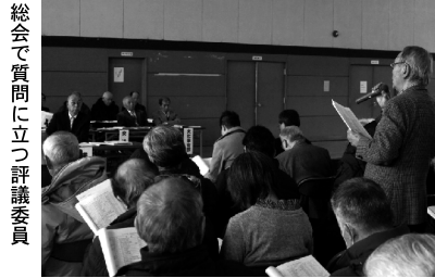
総会で質問に立つ評議委員 合った。睦が親

北海道新聞石丸販売所より 今回は諸般の事情により、「シーサイドタウンぜにばこ」の発行が遅れたことをお詫び致します。