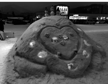
2月15日、16日に桂岡ラルズ前で行われた「なんとなく楽しむ会」の雪あかり。作品には同会が地元住民と製作したワックスボールも使用された