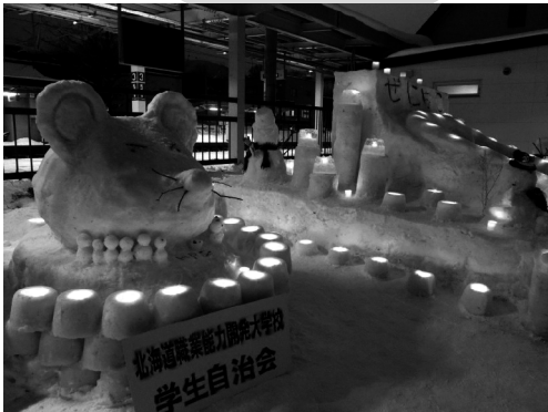
銭函駅前には北海道職業能力開発大学の学生による雪あかりも登場