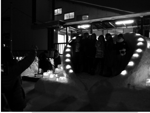
ハート型の雪あかりで記念撮影を楽しむ人も

記録的に少ない積雪の中、駅や神社に、雪あかりを楽しむ人々 「第22回小樽雪あかりの路」に合わせ、銭函でも個人や町会によるさまざま